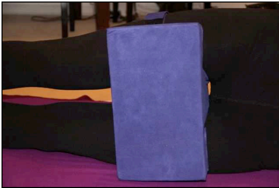
Seitenlage von vorne